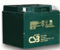
Batería tracción tubular 12V-40Ah (5h)